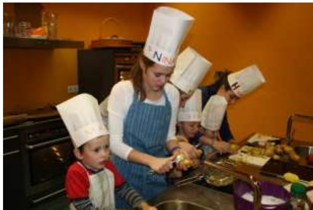
gemeinsam wird gekocht

Gemeinsam mit den Schülerinnen und Schülern der 1. Klassen der BAFEP kochen die Kinder einfache Gerichte und lernen vieles über gesunde Ernährung.