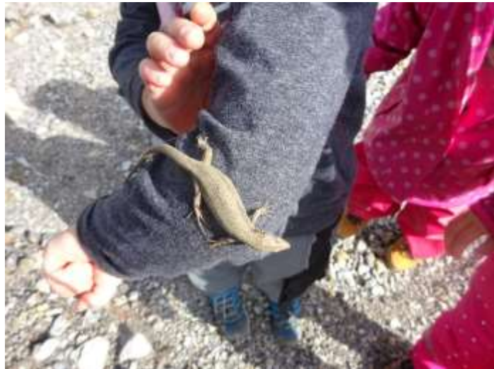
Kinder als Entdecker

Kinder sind kompetente und individuelle Wesen, die sich von Geburt an ihre Umwelt mit allen Sinnen aneignen. Sie sind Entdeckerinnen und Entdecker und erforschen von klein auf ihre Umgebung. Diese Neugier der Kinder ist die Basis für Lernerfahrungen.