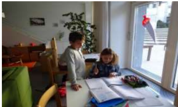
Fleißige Kinder bei der Hausübung... und beim Kochkurs

Das Freispiel ist auch im Hort neben der Begleitung der Hausübungen und der Freizeitangebote sehr wichtig. Die Kinder nutzen das vielfältige Spielangebot, oder die Zeit für schulische Belange. Die Kinder agieren ihren Wünschen gemäß im Gruppenraum, im Computer- oder Werkraum. Auch der Garten wird in dieser Zeit gerne genützt. Das Mittagessen wird von den Kindern in familiärer Atmosphäre gemeinsam eingenommen. Die Kinder erledigen ihre Hausübungen auf möglichst selbständige Weise. Sie werden dabei von den Pädagog:innen mit Impulsen unterstützt und begleitet, die sie zur Bearbeitung ihrer Aufgaben benötigen. Anschließend entscheiden sich die Kinder, ob sie an geplanten Angeboten der Pädagog:innen bzw. Schüler:innen der KBafEP teilnehmen, oder ob sie sich lieber erneut dem freien Spiel widmen möchten. Die freiwillige Teilnahme an Koch-, Werk-, Bewegungs-, Sprach- und Musikkursen, sowie an meditativen Angeboten bieten den Kindern vielfältige Möglichkeiten zur Entfaltung und Verknüpfung von bereits Gelerntem.